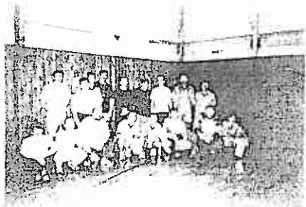
Lovinobaňa - Spišská Nová Ves 4:0