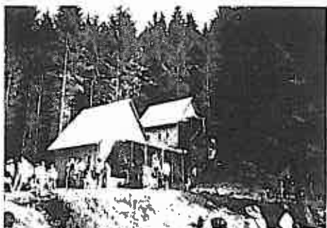
Všetci účastníci sa rozchádzali s pocitmi pekne prežitých chvíľ a s presvedčením, že o rok sa znovu stretnú, tentokrát na Slovensku a to vobei zvanej Revíšťské Podzámrčie. O konaní majstrovstiev Slovenskej republiky a Českej republiky sa viac dozviete na ďalších stránkach.

Zúčastnení zlatokopi mali v peknom prostredí Zlatých hôr možnosť okrem účasti na súťažiach absolvovať i viaceré výlety na veľmi zaujímavé lokality. V meste bolo možné navštíviť Banické múzeum a prezrieť si expozície dotýkajúce sa histórie regiónu, histórie baníctva, mineralógie a iné. V okolí mesta vedie náčný banický chodník. Za veľmi zaujímavý je možno pokladať i výlet do Údolia straccených štôl k rudným stupám a mlynom, ktoré predstavujú techniku stredoveku.